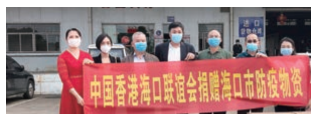
▲3月3日，中國香港海口聯誼會經香港航空運送68箱防疫物資，捐贈與海口市人民政府