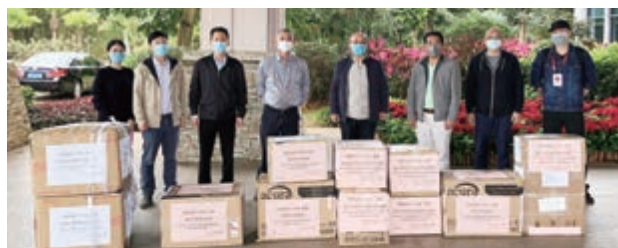
▲2月21日，香港海南農墾聯誼會、旅港瓊籍鄉親捐贈的11箱防疫物資經香港航空運送，捐贈給海南省人民醫院、海口市人民政府、海南農墾集團等

這些物資在海南省委統戰部的協調下，發往海南省人民醫院、海口市人民政府、三亞市人民政府、文昌市人民政府、瓊海市人民政府、海南農墾集團等地級市、縣級市、縣政府及機構，直達防疫第一線，助力防控新冠肺炎疫情。