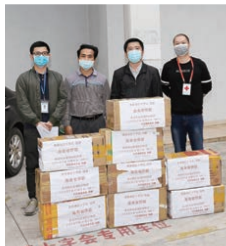
▲2月24日，印尼海南總會透過香港海南社團總會幫助，經香港航空寄回海南20箱防疫物資，捐贈與海南省僑聯

總會主動發揮社團組織的作用，利用香港自由貿易港的優勢，將全球僑胞、鄉團希望寄回家鄉的醫療物資在香港進行中轉。在新冠肺炎疫情爆發後，因全球各國多條赴瓊航線紛紛停航，海外僑胞急需寄回家鄉的醫療物資如何運抵家鄉成為了困擾愛國僑胞最大的難題。而香港赴瓊航班的運力限制、醫療物資管控和運輸費用等又成為了另一問題，在海航集團和香港航空的高度重視下，積極協調，